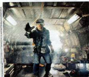
CINEMA Ready Player One di Steven Spielberg NELLE SALE Italiane

PESARO , via Rosalini, Teatro Sperimentale. Alle 21 Il ritmo del caos? Lo racconta Olimpia Fortuni in Fray . Mentre con Crossword Matteo Marfoglia esplora le emozioni di lingue incomprensibili. Al Teatro Rossini va in scena "Anticorpi Esplo", rassegna di "ballo d'autore" con performance in formato breve (massimo venti minuti).