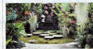
I Giardini La Mortella di Forio d'Ischia (Na)

FORTO D'ISCHIA (NA) , via F. Galise 45, Giardini La Mortella Magnolie orientali, glicini e camelie, la rampicante filippica Strongylodon macrobotrys con i grappoli di fiori turchesi lunghi fino a un metro. I Giardini La Mortella riaprono (dalle 9) per le sorprendenti fioriture primaverili dell'oasi tropicale curata dalla Fondazione William Walton. gmserta.it