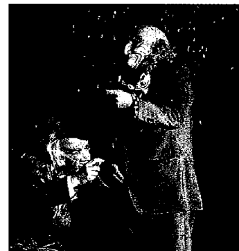
Ballerini Uno dei tre spettacoli di Emma Dante